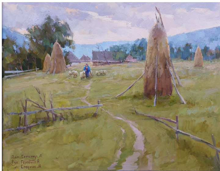
Рис. 5. «Вечір у полонинах». Дипломна робота ст. кафедри ОМ АХІ ОДАБА Семенчук Олександр, 2022 р

різних способів фільтрації та обмежень. Ряд європейських країн запроваджують спеціальні бар'єри для входу на ринок культурних послуг англomовного характеру, особливо американського походження.